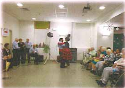
"MUSICA INSIEME" ALLA R.S.A. CAMBIAGHI