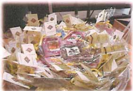
"I PIATTINI DI VETRO" DELLA COOP. ALIANTE