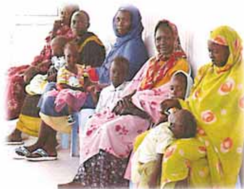
EMERGENCY CENTRO PEDIATRICO DI MAYO