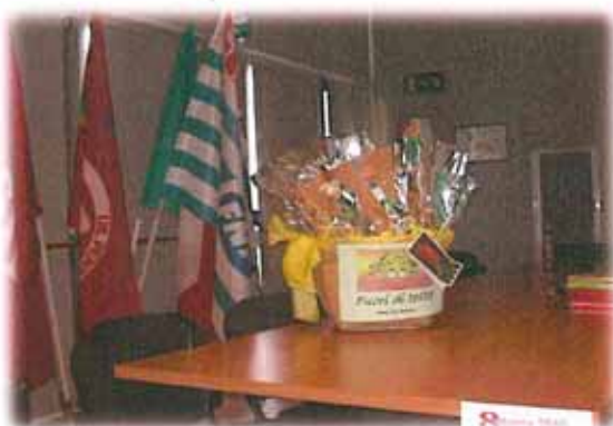
"LE ROSE" DELLE DONNE DEL CARCERE DI COMO