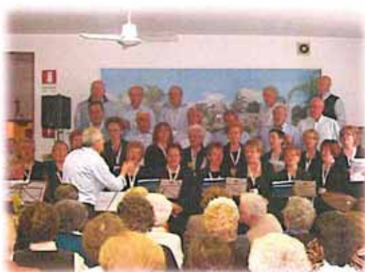
"IL CORO DELL'A.I.D.O." AL CENTRO ANZIANI