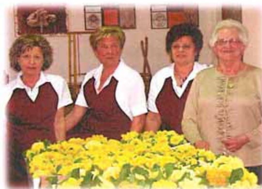
"INSIEME IN FESTA" AL CENTRO ANZIANI